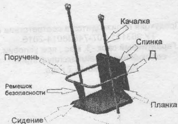
рис.2 Фрагмент качающейся части