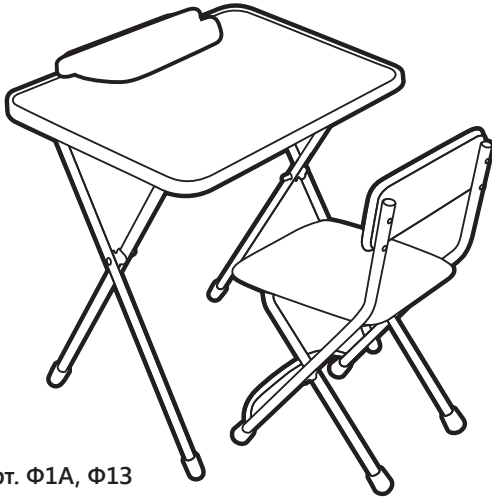
(рис. 1) арт. Ф1А, Ф13